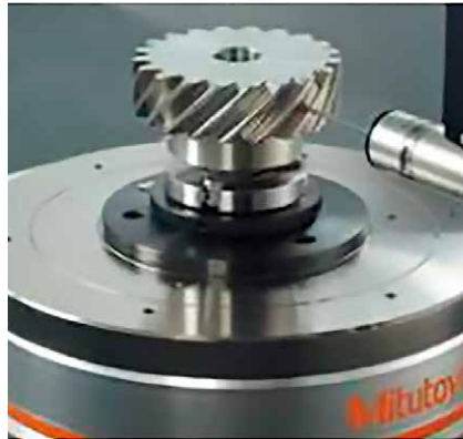
MRT240 Durchmesser der Tischfläche: 240 mm

Dank der Funktionen der KMG-Software MCOSMOS lassen sich die Teileprogramme für die zu messenden Werkstücke leicht erstellen, unabhängig davon, ob Merkmale bekannte oder unbekannte Führungskonturen aufweisen.