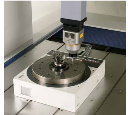
MRT320 Durchmesser der Tischfläche: 320 mm