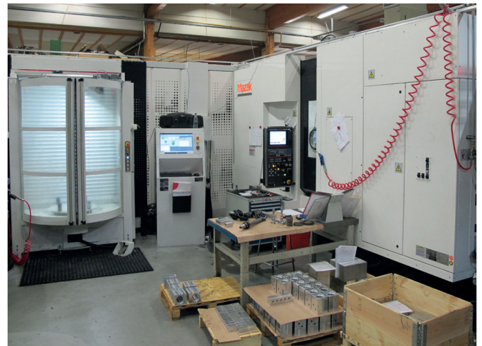
ST-KONEISTUKSEN VAAKAKARAISTEN KONEIDEN ARSENAALI ON YKSI SUOMEN LEIVEMPIÄ. KONEKANTAA UUSITAAAN VUOSI PER KONE TAHTIA.

”Tässäkin asiassa kannattaa taas muistaa pitkäjänteisyys. Eli vaikka joku työ ei ensimmäisen vuoden aikana olisikaan kehitystyön takia tuottavaa, 3–4 vuoden aikana se sellaiseksi saadaan käännettyä. Täytyy vain asiakkuuksia kartoittaessa etsiä pit-