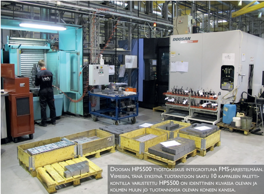
DOOSAN HP500 TYÖTÖKESKUS INTEGROITUNA FMS-JÄRJESTELMÄÄN. VIIMEISIN, TÄNÄ SYKSYNÄ TUOTANTOON SAATU 10 KAPPALEEN PALETTIKONTILLA VARUSTETTU HP500 ON IDENTTINEN KUVASSA OLEVAN JA KOLMEN MUUN JO TUOTANNOSSA OLEVAN KONEEN KANSSA.

olemme töitä myös menettäneet. Mutta nämä menetykset on saatu paikattua aktiivisella uusasiakashankinnalla. Kun jonkun työn menettää, täytyy vain aktivoitua entistä terävämmäksi uusiasiakkuuksia kartoittaakseen. Meillä on ollut varmasti myös onnea, mutta ihmeen hyvin olemme loppuneet työt on-