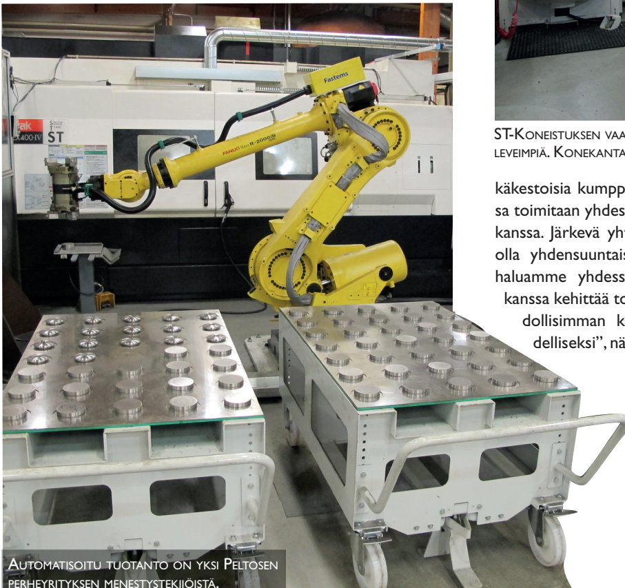
AUTOMATISOITU TUOTANTO ON YKSI PELTÖSEN PERHEYRITYKSEN MENESTYSTEKIJÖISTÄ.

ta-alamme kasvaisi 7600 m 2 :iin. Uuteen halliin voimme sijoittaa vaikka jotakin asiakastamme varten oman FMS-linjan. Eli asiakastarpeiden mukaan tässäkin asiassa edetään”, kertoo Peltonen. ■